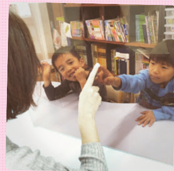
ビジョントレーニングでは先生の指と追いかけてっこをしています。動くものをしっかりと目で追う力を高めています。