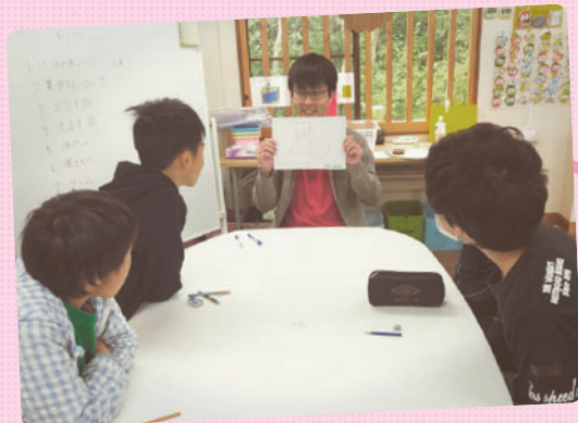
視覚的記憶力と集中力を高める課題では様々な教材を使用し、子供たちの興味を惹きつけながら力を高めています。

さくらの日常を毎日発信している「さくら日記」から11月の活動をピックアップしました。