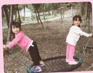
エリクソン校の森ではブランコが大人気！ブランコが揺れるたびに風が当たって気持ちよさそうでした。