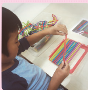
ケイマナスクールとさくら生個別指導ではTEACCH課題学習を取り入れており一人一人の発達に合った課題に取り組んでいます。