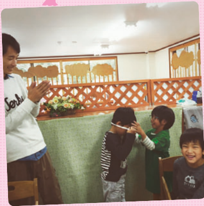
さくらっ子クラブで、10月生まれのお友だちのお祝いをしました！ みんなから祝福の言葉がかけられました♪