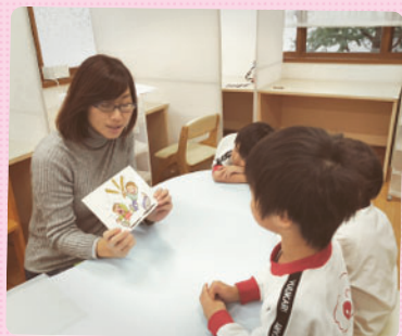
SSTでは、状況認知絵カードを使いながら子どもたちの身近で起きそうなトラブルについて学びました。