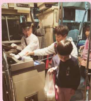
お買い物学習では、バスに乗りスーパーでお買い物をしてハロウィンの工作をしました。