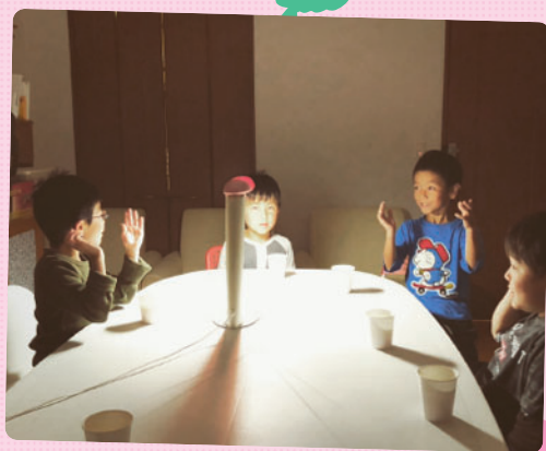
お誕生日のお祝いをしているところなんですが子どもたちのアイデアで、ケーキのろうそくを吹き消す代わりに、ろうそくに見立てたライトを消しました！