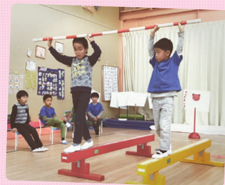
GYMのプログラムでお友だちと協力して行う「協力棒運び」。平均台を渡るスピード、歩幅、相手の様子をしっかりと見て合わせるが必要な運動です。