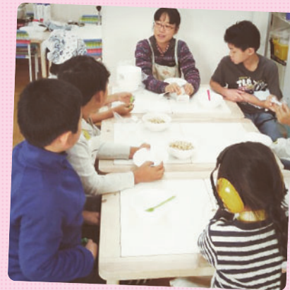
さくらっ子クッキングでは「さつまいものポターージュ」を作りました！