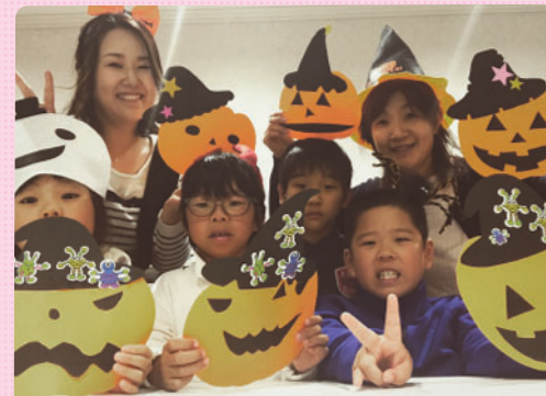
みんなでかぼちゃおぼけを作りました！可愛い顔、怖い顔、それぞれ好みは違いますがとっても可愛いかぼちゃたちが出来上がり～