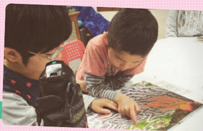
休憩時間に2人で迷路の本を見ていました。2人とも、お互いがゴールできるまでページをめくるのを待っています。相手への配慮ができていますね♪