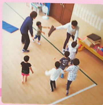
森のホールで自由遊びをしていると「ジリリー!!」と サイレンが。座布団をもらって避難します。