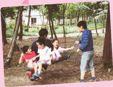
エリクソンの森での一コマです。 年の離れたお友だちと関わるができるのも さくらっ子クラブの素敵なところですね。