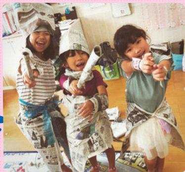
新聞紙をスカートにしたり、腕輪や帽子を作ったり 子どもたちの自由な発想あふれるあそびの時間は 素敵な笑顔でいっぱいです！