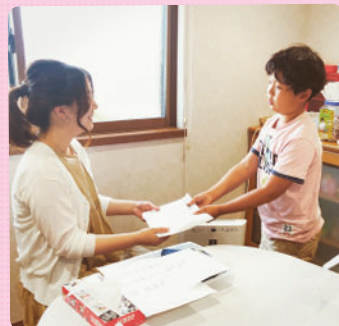
書類の渡し方について学習しました。 相手の向きにすること、綺麗に揃えて渡すことを 学びました。