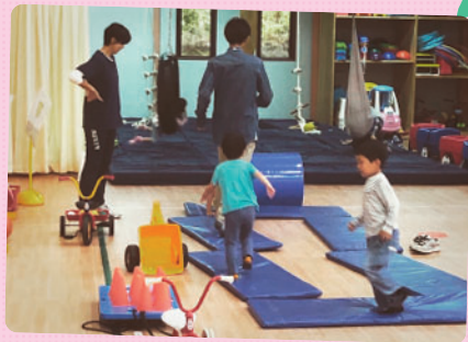
自由あそびでは、マットの形を変えながら 楽しい遊びを作り出していました！