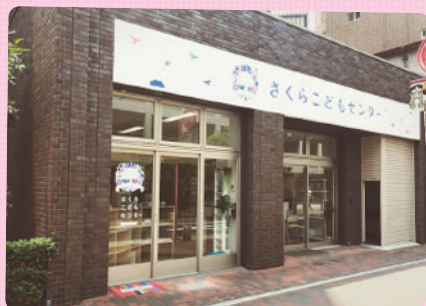
6月から【神戸北野校】が開校しました！ 早速、6名の子どもたちが指導をスタートしています。