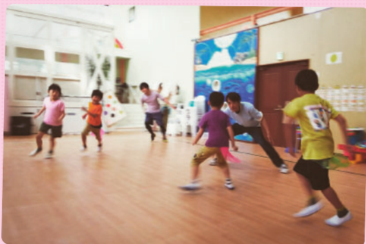
エリクソン校で4月から始まったサッカー教室。 みんな安心できる環境の中で、楽しみながらサッカーを 学ぶことができます♪