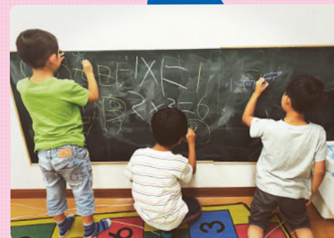
フラワー校のプレイルームに黒板が設置されました！ みんな夢中でお絵かきを楽しんでいます♪