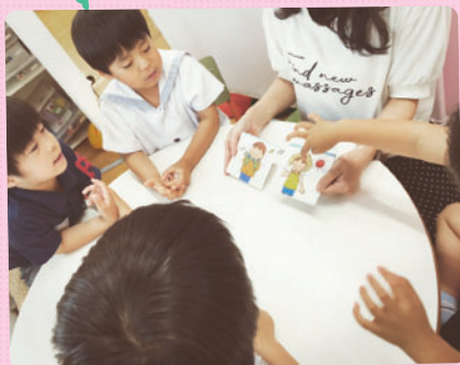
ケイキマナでは最後にSST学習をしています。 絵カードを用いて、善悪の判断を高めたり マナー等を学びます。