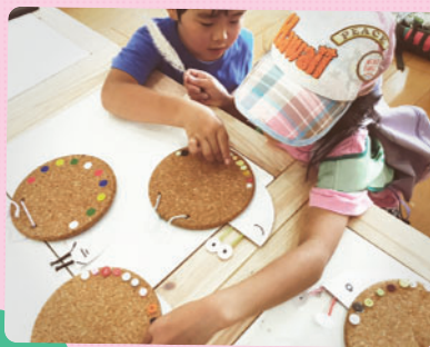
さくらっ子クラブでは、カタツリの メッセージボードを作りました！ 事前に工作のお約束をして、材料や道具を 仲良くつくことを確認してスタート！