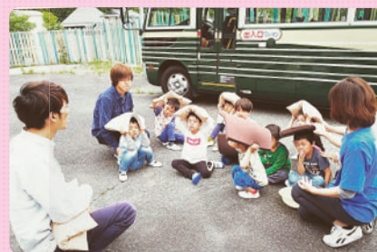
避難場所の中庭に到着！点呼をとり 全員揃っていることを確認。朝の会で学んだことを 全員意識することができました。