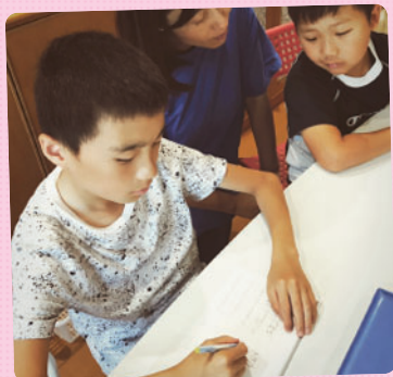
言葉集めの学習では、お友だちとペアで 考えてもらいました。今日の方がたくさん思いつき、 協力することの大切さを 実際に体験する時間となりました！