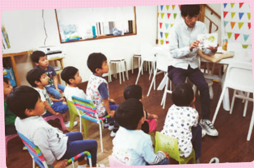
ケイキマナエリクソン校では避難訓練を行いました！ 朝の会で地震や火事が起きた際にどうしたら良いか 紙芝居で学びました。