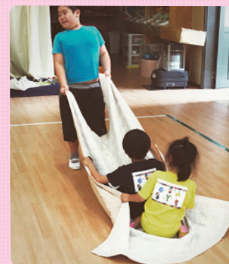
GYMの休憩時間に、楽しそうに 遊んでいました。 自由時間も、子ども同士で 楽しい遊びを考えています。