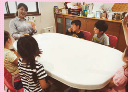
SSTグループでは、日常生活で体験する 様々な出来事をテーマに 絵カードを用いて学習を行います。