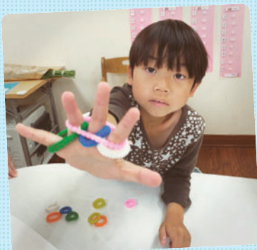
Bグループでは、見本カードと同じように6色のゴムを指にはめていくゲームを行いました！指先の巧緻性、模倣力を高めます♪