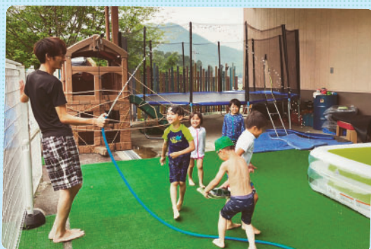
ケイキマナスクールの水あそびでは、入る前にお約束を確認してから水あそびスタート！水のトンネル、上手にぐれていました。