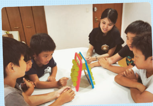
チームワークが試されるゲームを行いました。それぞれ自分の意見を持っていますが、目標を思い出し、相手の意見に耳を傾けたり、まだ発言していない子に話を振ったりと良いチームワークを発揮してくれました！