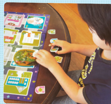
さくらっ子クラブのIT学習では、プログラミングカーを使った学習を行いました。どのような動きを組み合わせたら目標が達成できるか、筋道を立てて論理的に考える力を、楽しみながら育てています。