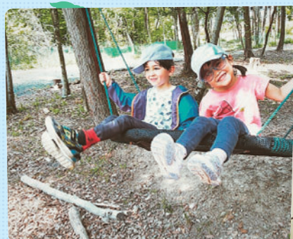
ケイキマナスクールでは子どもたちの可愛い、心からの笑顔がたくさん見られました♪