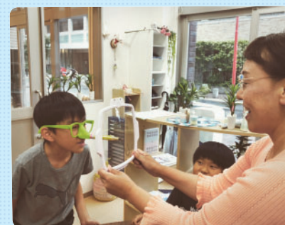
神戸北野校でも、はじめてのさくら生SSTグループ指導がスタートしました。はじめて3人が揃いドキドキしましたが、とても仲良く90分間頑張り、最後のゲームではみんなで楽しむことができました！