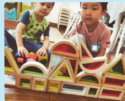
自由遊びで、一人のおさんがつくっていると何人かの子が集まってきて、仲良く一緒に作っていました！