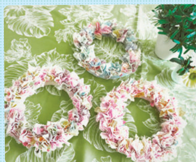
さくらっ子クラブ今年の夏休み工作はとても綺麗な「さくさくりース」。選ぶ生地の色や柄によって違う雰囲気のリースができて上がるので男女問わず楽しんでいただける工作です！