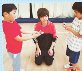
英会話教室では、協調性、タイミング、勝敗の受け入れ、など様々な要素を取り入れながら、楽しんで英語も学んでいます♪