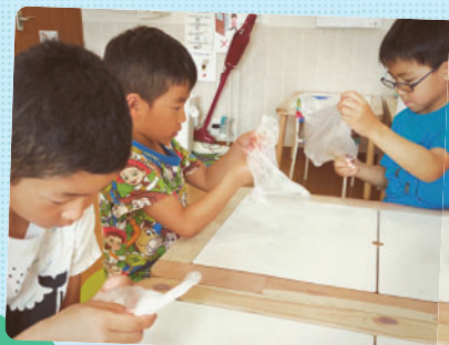
さくらっ子クラブの実験遊びでは、調味料を使い10円玉をピカピカにする実験をしました！