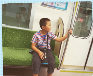
神戸市営地下鉄 西神・山手線に導入された新型の6000形について調べました。 ドッキングプログラムでは、実際に現地へ向かうこともあります。 好奇心、探究心を大切に伸ばしていくプログラムです。