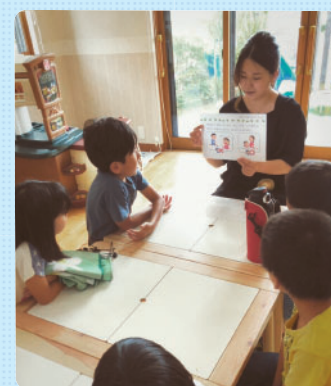
さくらっ子クラブのお買い物学習では、店内での声のボリュームや挨拶等のマナーを確認します。さて、出発！！