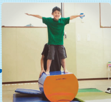
さくらっ子 GYMでは、ぐらぐら揺れるドームの上でまっすぐ立てるバランス感覚を養います！